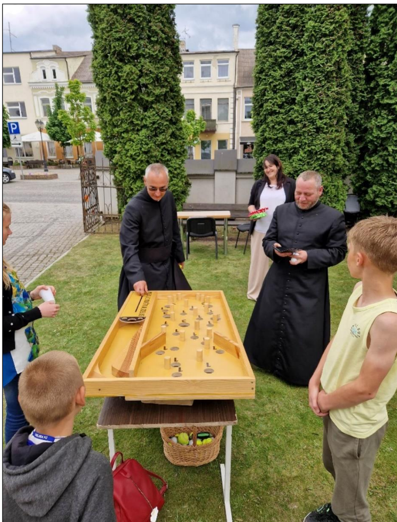
Viena iš populiariausių išvažiuojamų edukacijų – „Senoviniai stalo žaidimai“.