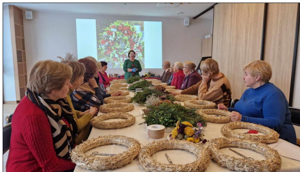
Kalėdiniu laikotarpiu vykstanti edukacija „Advento vainikas“.