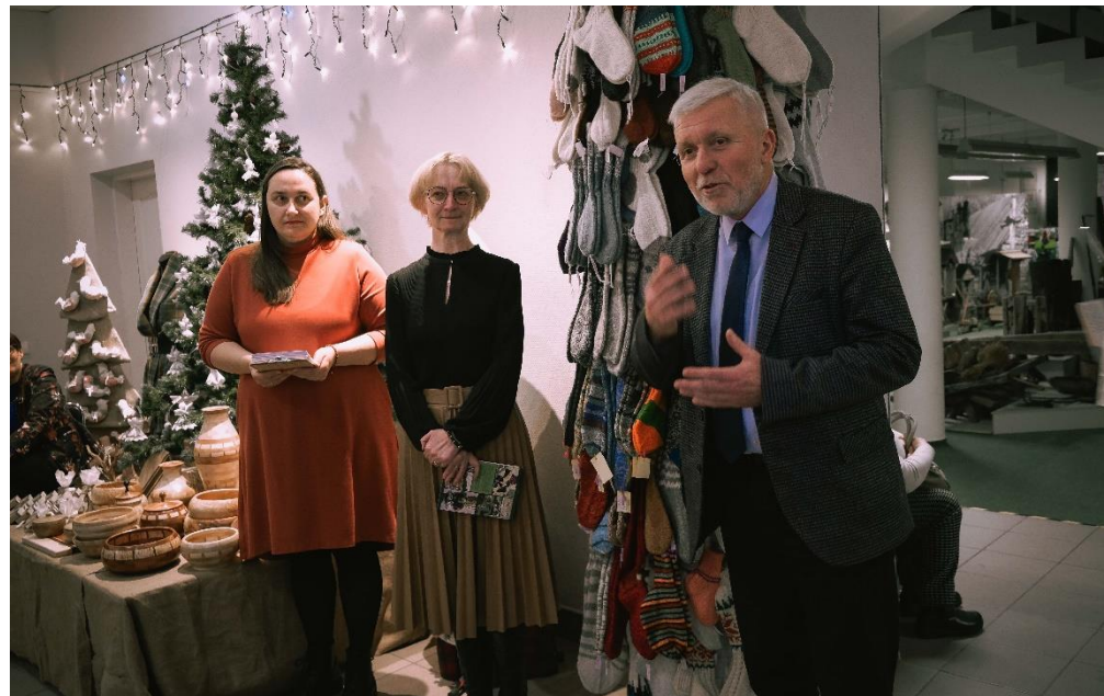
Tradicionēs Kalēdu mugēs-parodos „Metai“ atidarymas.