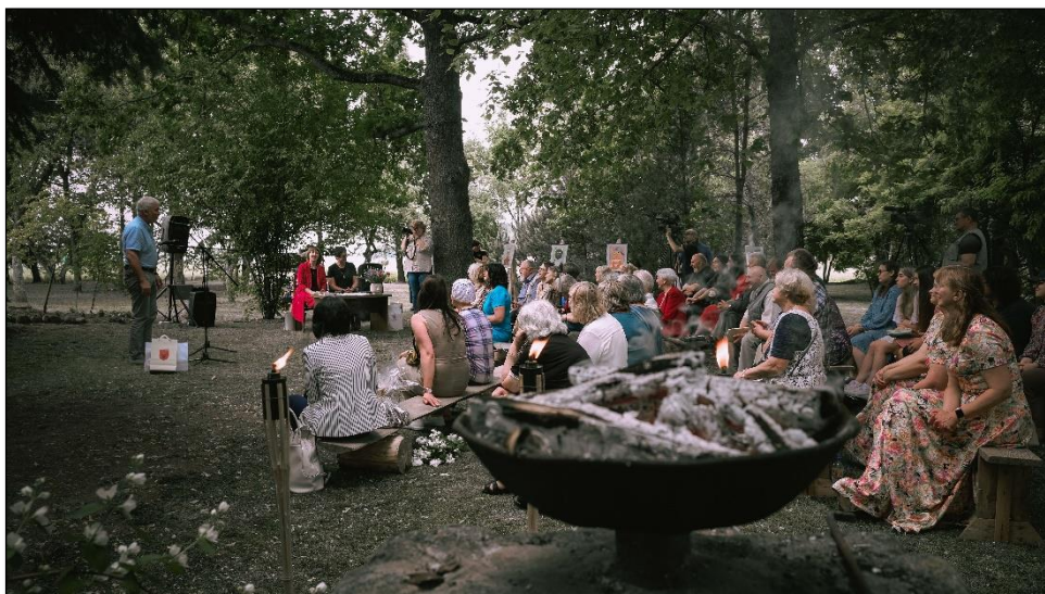
Tradicionē poezijas šventē „Krinčinoverdenēs-29“.