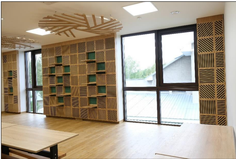
Dekoratyvinėmis interjero detalėmis atnaujinta edukacinė klasė.