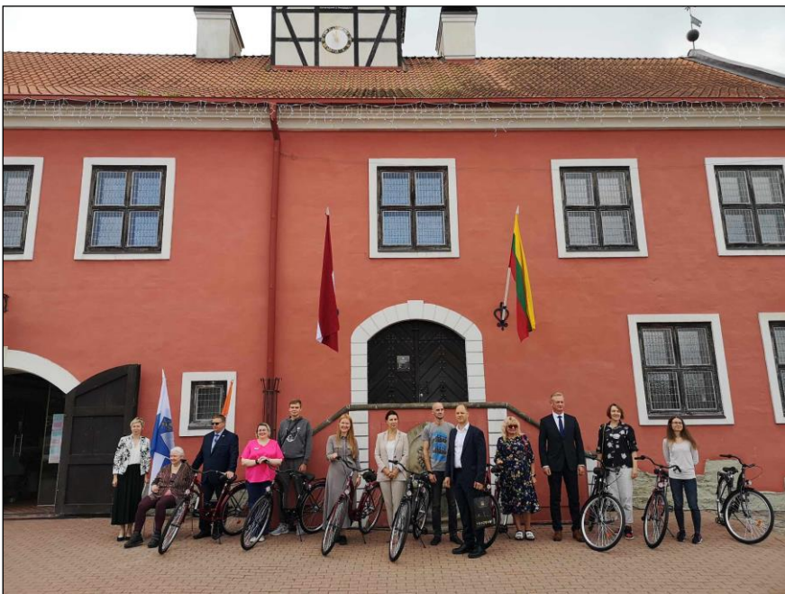
Tarptautinės turizmo akcijos „Pažinkime kaimynus Žiemgaloje“ uždarymas.

Turizmas. Muziejus, atliekantis Turizmo informacijos centro funkcijas, rinko, kaupė, atnaujino informaciją apie Pasvalio rajono turizmo išteklius ir paslaugas. Nuolat skelbta informacija Facebook platformoje, internetinėse svetainėse ( www.visitpasvalys.lt , www.pasvalys.lt ir kt.), teikta informacija telefonu ir el. paštu. Pateikta informacija apie Pasvalio r. lankytinus objektus, turizmo naujienas Nacionalinei turizmo skatinimo agentūrai „Keliauk Lietuvoje“, Lietuvos turizmo naujienas skelbiantiems portalams Facebook sistemoje „We love Lithuania“, „Lankytinos vietos Lietuvoje“, „Ką pamatyti Lietuvoje“, „Keliaujančios mamos“, „Lankomiausių objektų TOP10“ „Šilčiausi“ lankytini objektai žiemos sezono metu“ ir kitiems portalams. Nuolat pildyta LR turizmo rūmų duomenų bazė – teikta atnaujinama informacija, nuotraukos apie Pasvalio r. turistinius išteklius ir paslaugas. Pateikta leidiniams medžiaga ir nuotraukos apie Pasvalio kraštą. Pristatyti Pasvalio r. turizmo ištekliai radijo ir TV laidose. Aktyviai dalyvauta rengiant tarptautinį maršrutą „Pažinkime kaimynus Žiemgaloje 2023“. Bendradarbiauta su turizmo paslaugų teikėjais, gaunant iš jų informaciją ir perduodant jiems turizmo naujienas. Suorganizuotos 7 pažintinės ir poilsinės kelionės. Muziejaus organizuotose ekskursijose po Lietuvą keliavo 261 turistas. Parduoti 47 keltų bilietai, keltais iš viso keliavo 88 žmonės ir 41 automobilis. Parduota 20 lėktuvo bilietai.