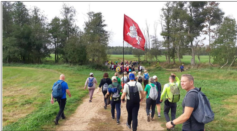
Pēsčiju žygis „Ten, kur kovēsi sukilēliai“, skirtas Sukilimo 160-osioms metinēms.