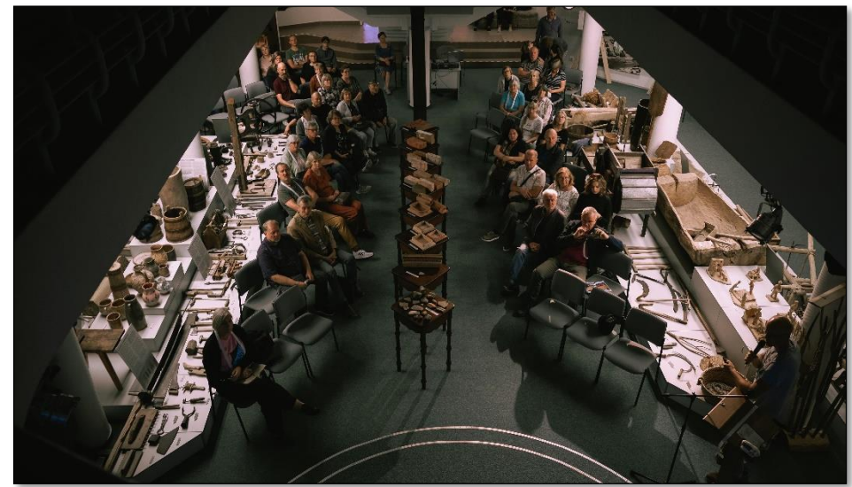
Europos paveldo dienų renginys „Plytų kelias Pasvalio krašte“.