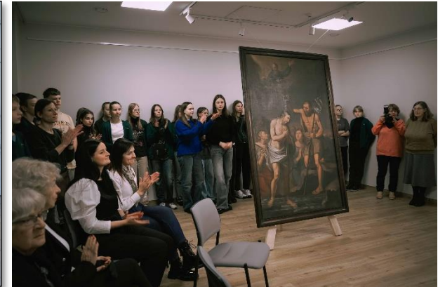
Vieno eksponato paroda „Jėzaus krikštas“.