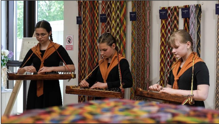
Paroda „Juostų pyrimo tradicija: Žmonės ir spalvos“.

2023 metais Muziejuje buvo surengta apie 40 vizualaus meno, taikomios dailės, etninio ir kitokio pobūdžio parodų. Parodose buvo galima susipažinti tiek su kraštiečių darbais, tiek su kviestiniais parodų autoriais. Svečių kūrybos pristatymas prisideda prie Pasvalio krašto žmonių kultūrinio-meninio akiračio praplėtimo. Parodų erdvėse pristatyti savo darbus galėjo ir Pasvalio rajono savivaldybėje veikiančios draugijos (neįgaliųjų draugija „Esame ir būsimė“), klubai („Rats“, „Kraitė“), Pasvalio muzikos mokyklos Dailės skyriaus moksleiviai. Ypač didelio Muziejaus lankytojų susidomėjimo sulaukta per privačių žmonių sukauptų kolekcijų pristatymus. Per ataskaitinius metus taip pat buvo parengtos 4 virtualios ir 1 lauko paroda, skirta Žolinių šventei.