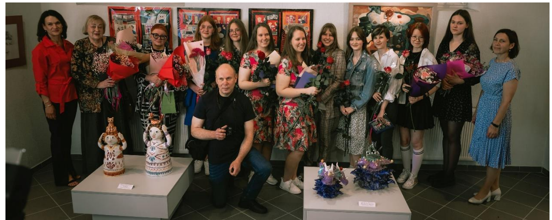
Pasvalio muzikos mokyklos dailės skyriaus absolventų baigiamųjų darbų paroda.