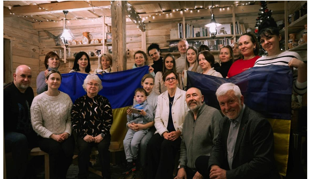
Projekto „Kulinarinio paveldo pažinimas“ įgyvendinimo akimirka.

Projektinė veikla, muziejaus erdvių atnaujinimas. 2023 metais Muziejus parengė 10 paraiškų projektams, finansavimas gautas keturiems projektams: „Pėsčiųjų žygis „Ten, kur kovėsi sukilėliai“, „Etnokultūriniai susitikimai“, „Edukacijos ir ekskursijos Lietuvoje“ ir „Kulinarinio paveldo pažinimas“. Pastarieji du projektai buvo skirti prisidėti prie geresnės Pasvalio krašte apsisotusių karo pabėgėlių – ukrainiečių, integracijos. Aštuoni bendri projektai vykdyti su kitomis įstaigomis ir organizacijomis. Siekiant pagerinti Muziejaus lankytojų aptarnavimo kokybę ir muziejaus erdvių vizualinę būklę buvo atnaujinta Muziejaus edukacinė klasė ir pagrindinės ekspozicijos dalis (įgarsintojui skirta erdvė). Atnaujinimai atlikti pagal architektų sukurtas vizualizacijas, pasiūlytus interjero sprendimus.