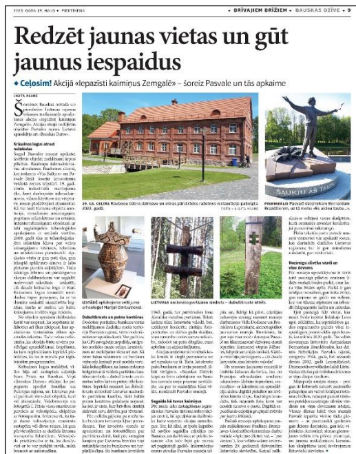
Pasvalio r. lankytinų objektų pristatymas Latvijos spaudoje.