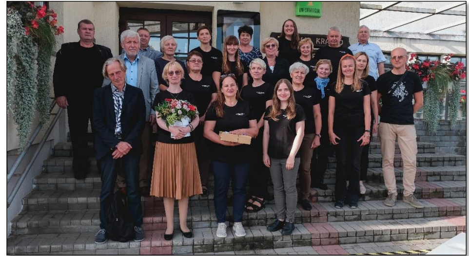
Pasvalio krašto muziejaus 25-mečio minėjimo renginys.

Kultūriniai renginiai ir parodos. Per ataskaitinius metus Muziejus suorganizavo 72 kultūrinius renginius. Muziejuje vykę renginiai išsiskyrė savo įvairove: mokslinės konferencijos, susitikimai su kraštiečiais, atmintinų dienų minėjimai, paskaitos, naujų ekspozicijų ir knygų pristatymai, spektakliai, žygiai, literatūrinės šventės, koncertai, prisiminimų vakarai, kino seansai. Dėl šios priežasties, padidėjo Muziejaus žinomumas tarp įvairaus amžiaus žmonių grupių. Suorganizuoti kultūriniai renginiai neapsiribojo tik Muziejaus erdvėmis, jie taip pat vyko Krinčino miestelyje, Svalios parkelyje. Išskirtinis renginys – Pasvalio krašto muziejaus 25-mečio minėjimas, kurio metu Muziejaus rinkiniai pasipildė Vilniaus pasvaliečių dovanotomis vertingomis fotografijomis.