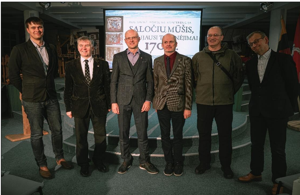
Mokslinē konferencija „Saloču mūšis. Naujausi tyrinējimai. 1703“.