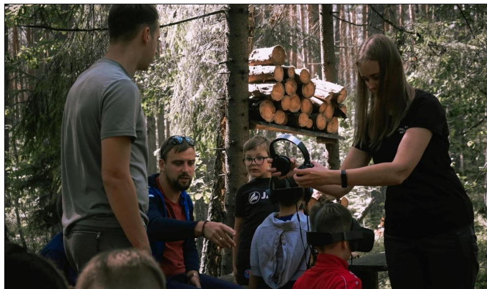
Edukacija, iliustruojanti partizanų kasdienybę ir kovą už laisvę, Žadeikių miške.