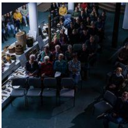
Vilniaus universiteto Istorijos fakulteto organizuota istorinė konferencija „Praeities atsivėrimai“ žmonės, įvykiai, paveldas“