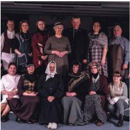
Tarptautinės Muziejų nakties renginys „Kai ateina naktis, muziejaus eksponatai atgyja“