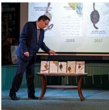
Muziejaus ir asociacijos „Žiemų pradas „Simkala“ išleisto leidinio „Žiemgala XIII a. dokumentuose“ pristatymas