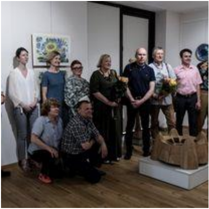
Pasvalio menininkų klubo „Rats“ jubiliejinės parodos atidarymas