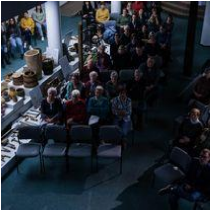
Vilniaus universiteto Istorijos fakulteto organizuota istorinė konferencija „Praeities atsivėrimai“ žmonės, įvykiai, paveldas“