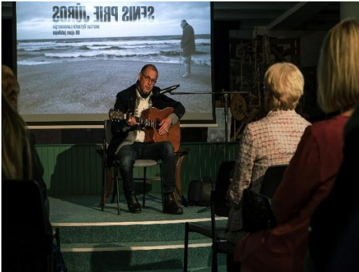
V.V. Landsbergio filmo „Senis prie jūros“ apie Vytautą Landsbergį pristatymas