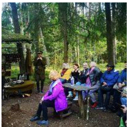
Projektas „Pasvalys – Biržai: tvaraus paveldo kryptis Šiaurės Lietuvoje“