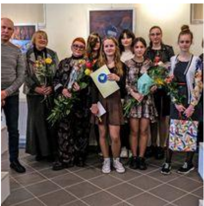
Pasvalio muzikos mokyklos Dailės skyriaus absolventų dailės darbų parodos atidarymas