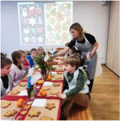
„Kalėdinio meduolio dirbtuvės“