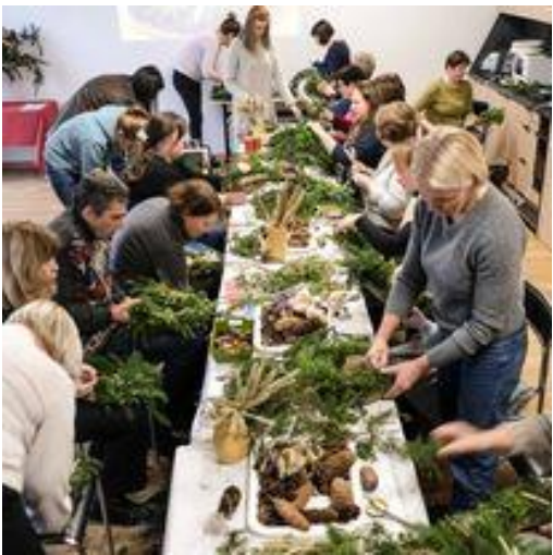
„Adventinio vainiko dirbtuvės“