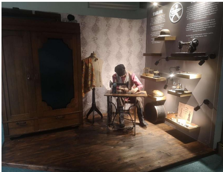
Siuvėjo („Kriaučiaus“) interaktyvi ekspozicija

Pasvalio rajone muziejinę veiklą vykdo Pasvalio krašto muziejus (toliau – Muziejus), lankytojams duris atvėręs 1998 m. 2010 m. Muziejus buvo iš esmės renovuotas ir modernizuotas. Kiekvienais metais modernizuojamos ir atnaujinamos atskiros ekspozicijos. 2022 m. atnaujinta etnografijos ekspozicija, integruojant naują interaktyvų kūrybinį sprendimą – Siuvėjo („Kriaučiaus“) ekspozicija. Muziejaus rūsyje atnaujintas Pabėgimo kambarys „Už kadro“ bei įrengta ekspozicija, skirta senajam Pasvalio kino teatrui. 2022 m. įveiklintos edukacinės patalpos ir meno galerija naujajame Muziejaus priestate.