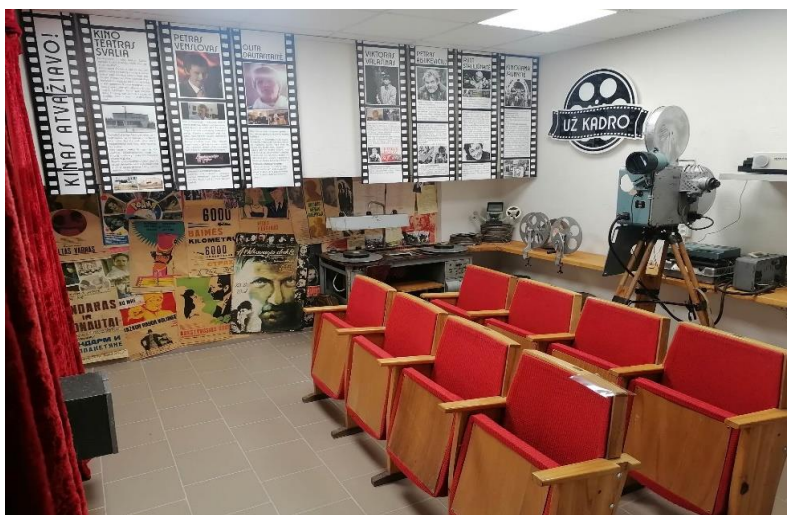
Įrengta ekspozicija, skirta Pasvalio kino teatro istorijai