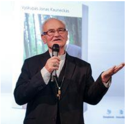
Susitikimas su JE vyskupu Jonu Kaunecku, atsiminimų knygos „Prieš visus vėjus“ pristatymas