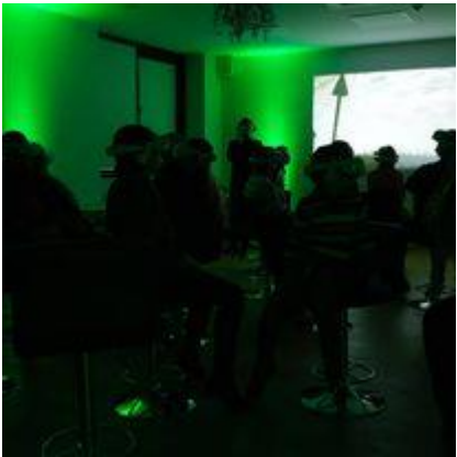
Virtualaus realybės filmo „Angelų takais“, sukurto pagal M.K. Čiurlionio kūrybą, demonstravimas (70 seansų)