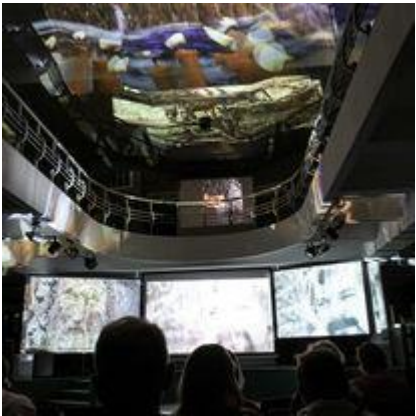
Ukrainiečio režisieriaus Aleksandro Dirdovskio filmo „Orvido verdenė“ pristatymas – renginys, skirtas skulptoriaus, vienuolio Viliaus Orvido 70-osims gimimo ir 30-osioms mirties metinėms