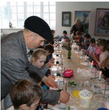
Velykų papročius atskleidžianti edukacija „Velykų džiaugsmas“

2022 m. Muziejų aplankė daugiau kaip 40 000 lankytojų, iš jų 18 530 vaikų. Prarastos 606 ekskursijos po Muziejų ir po miestą, prarasta 214 edukacinių užsiėmimų, kuriuose sulaukėme 3959 dalyvių. Muziejaus darbuotojai vedė edukacinius užsiėmimus ne tik Muziejaus patalpose, bet ir išvykose Panevėžyje, rajono šventėse ir kt. Suorganizuoti 74 renginiai, surengta daugiau kaip 40 vizualaus meno, tautodailės ir kt. parodų.