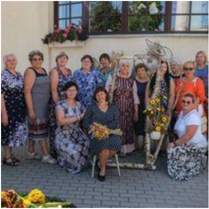
Pasvalio rankdarbių klubo „Kraitė“ 20-mečio paminėjimo renginiai