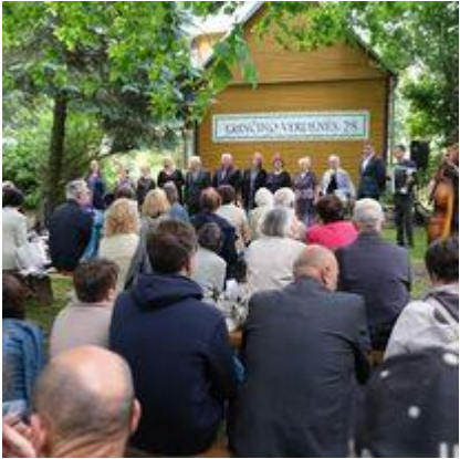
Tradicinis poezijos renginys „Krinčino verdenės“