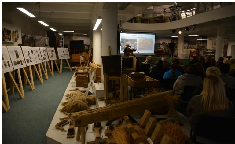
Istorinė konferencija „Karaimai Šiaurės Lietuvoje“, skirta paminėti Lietuvos karimų metams