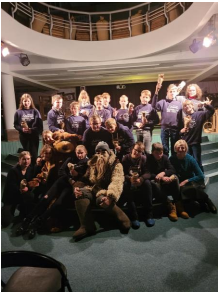
Kalėdų burtai, papročiai, žaidimai, senis Kalėda ir dovanėlės – edukacija „Vidury dvaro meška karo“