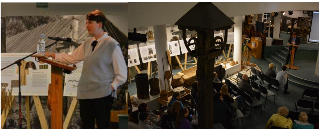
Istorinė konferencija „Karaimai Šiaurės Lietuvoje“, skirta paminėti Lietuvos karimų metams