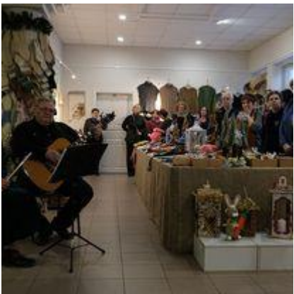
Tradicinės Kalėdinės parodos-mugės „Metai“ atidarymas