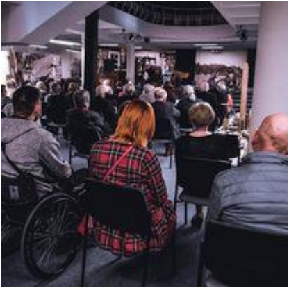
Pasvalio r. neįgaliųjų draugijos ataskaitinis-rinkiminis susirinkimas, meninė programa