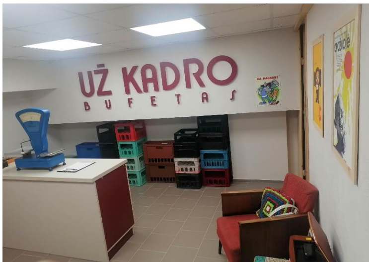
Muziejaus rūsyje atnaujintas Pabėgimo kambarys „Už kadro“