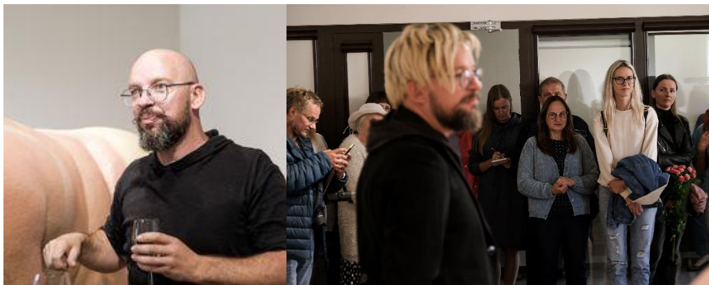
Skulptoriaus Martyno Gaubo parodos atidarymas