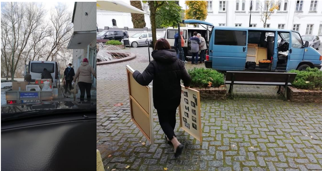
Ekspонатų pervežimas iš saugyklų Pasvalyje į buvusios Valakėlių mokyklos patalpas

2022 m. baigtas Muziejaus eksponatų pervežimas į naujas saugyklos patalpas.