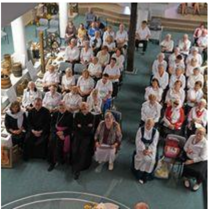
Pasvalio katalikių moterų draugijos įkūrimo 100-čio jubiliejaus minėjimas