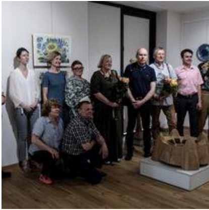
Įveiklinta meno galerija naujajame Muziejaus priestate

2022 m. Muziejus parengė 8 projektus, finansavimą gavo šešiams projektams: Lietuvos kultūros tarybos finansuotas tęstinis projektas „Žiemgala XIII a. dokumentuose“ (4500,00 Eur); Lietuvos kultūros tarybos finansuotas projektas „Mokslinė konferencija „Iš penkių šimtmečių istorijos: Pasvalio praeities fragmentai“ (1750,00 Eur); Kultūros paveldo departamento prie Kultūros ministerijos finansuotas projektas „Pasvalys – Biržai: tvaraus paveldo kryptis Šiaurės Lietuvoje“ (800,00 Eur); Pasvalio rajono savivaldybės jaunimo reikalų tarybos finansuotas projektas „Pėsčiųjų žygis „Praeities pėdsakais“ (600,00 Eur).