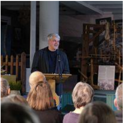
Projektas „Mokslinė konferencija „Iš penkių šimtmečių istorijos: Pasvalio praeities fragmentai“, skirta Pasvalio 525 metų jubiliejui