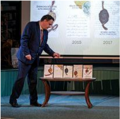
Tęstinis projektas „Žiemgala XIII a. dokumentuose“