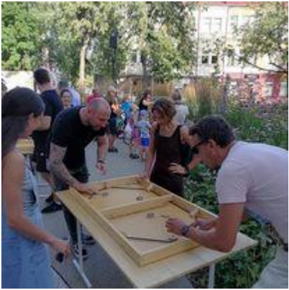
Senovinių žaidimų edukacijos, VR akinių pristatymas Panevėžyje