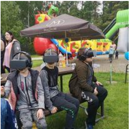
Senovinių žaidimų edukacijos, VR akinių pristatymas Pasvalio parke