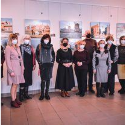
Panevėžio krašto tautodailininkų tapybos darbų parodos „Panevėžys laiko tėkmėje“ atidarymas