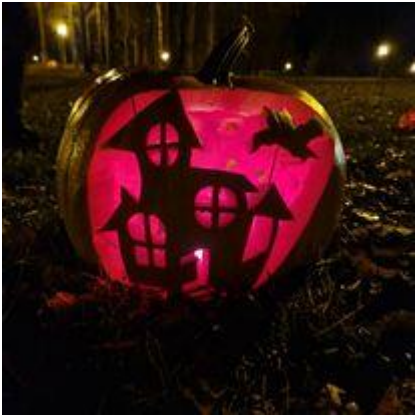
Muziejaus inicijuota visuomeninė rudens akcija „Apšvieskime Smegduobių parką moliūgų žibintais“